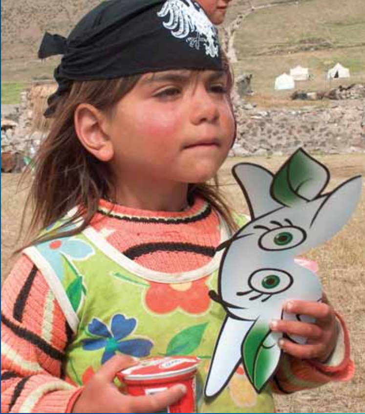
Pınar Kido Çocuk Tiyatrosu