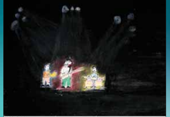
Zeynep Ekiz Hakan Akbryk İlköğretim Okulu ANKARA