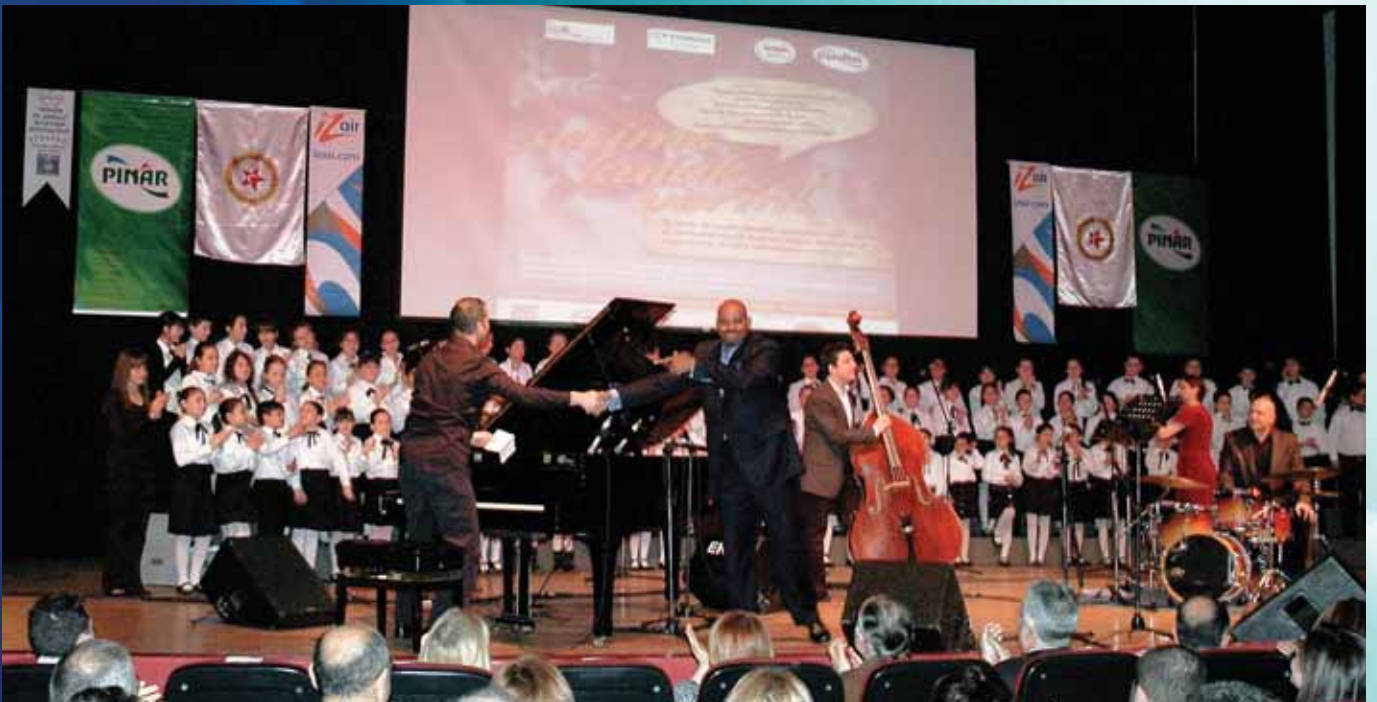
TOBAV-Pınar "Sesime Kulak Verin"