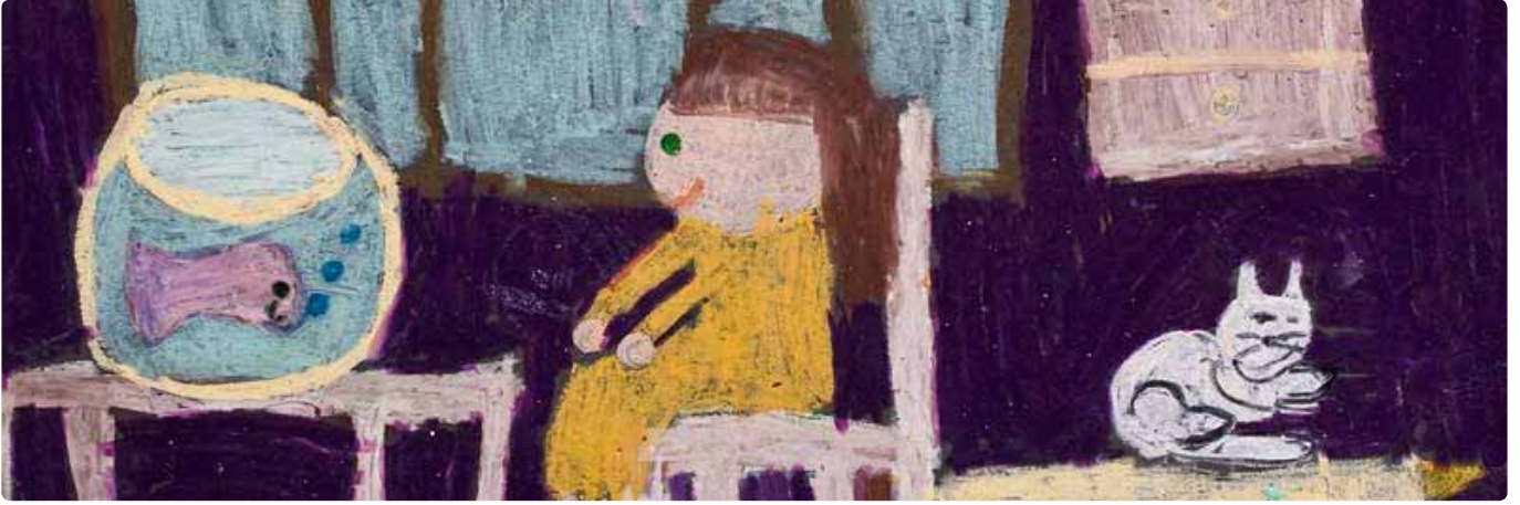
29. Pınar Kido Resim Yarışması'na 887.660 adet resim ile rekor başvuru gerçekleşti.