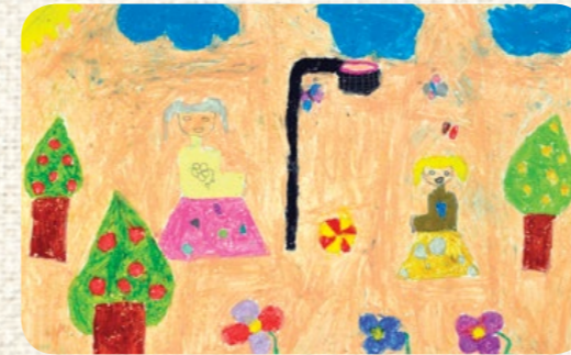
CEYDA ÇELİK / KURUM İÇİ / İZMİR