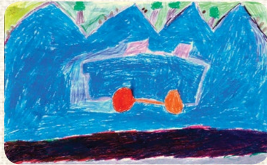
URAS ÇERİBAŞI / KIBRIS