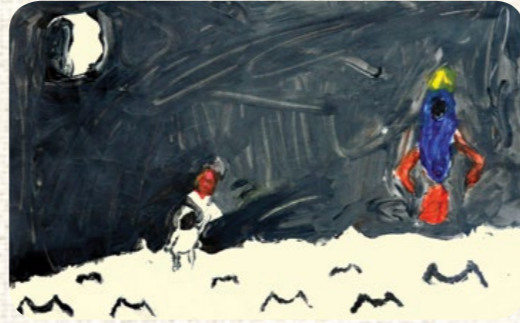
ÖZGE KAYA / KAYSERİ