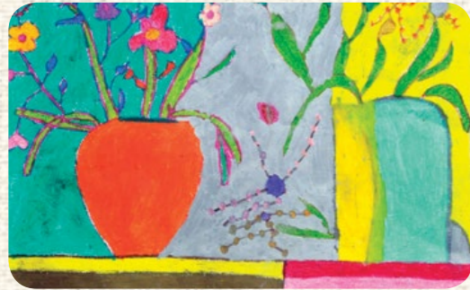
EYLÜL KOÇ / TRABZON