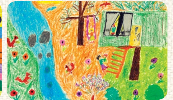
AYTUNÇ DEMİRKAYA / KURUM İÇİ / İZMİR