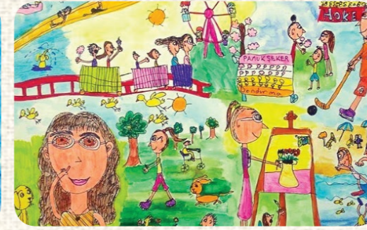
ELA YILDAN / SOSYAL MEDYA / İSTANBUL