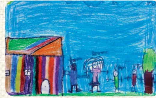
EREN OĞLAK / ÖZEL EĞİTİM UYGULAMA OKULLARI / ANKARA