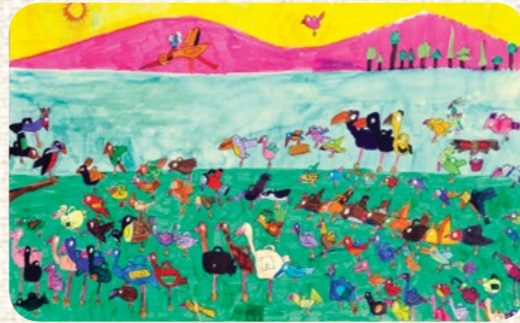
ARDA TİBET ADIYAMAN / İSTANBUL