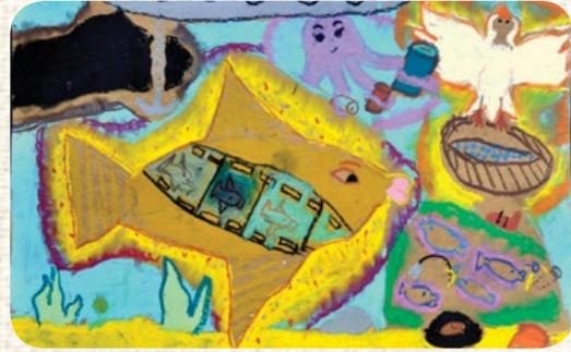
DAMLA UZ / İZMİR