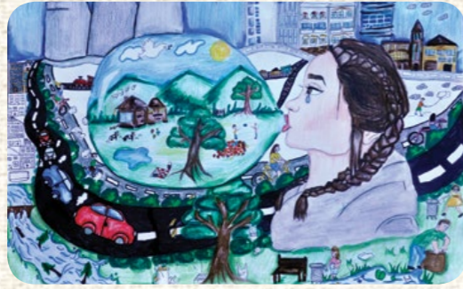
AYSU AHMEDOVA / ALMANYA