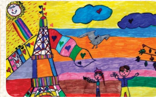
CEYLİN SUCUKA / KURUM İÇİ / İZMİR