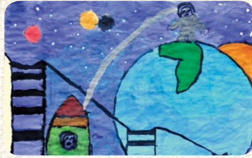
YUNUS EMRE ÖZKAN / HAKKARİ