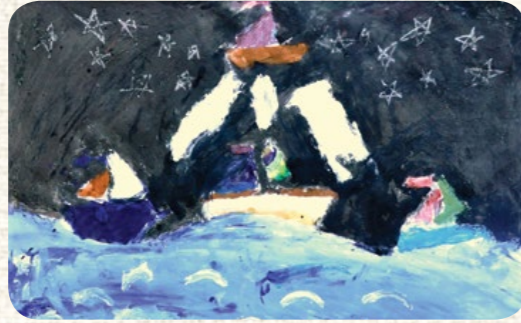
BESNA YILDIZ / BATMAN